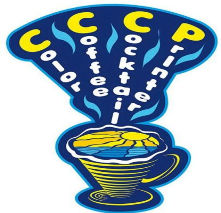
Color Cofee Coctail Printer